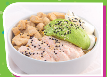
Arroz frito con verduras (375 g).