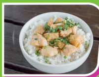
Arroz al vapor (375 g).

Extra especial $25 (agrega queso, Philadelphia y aguacate)